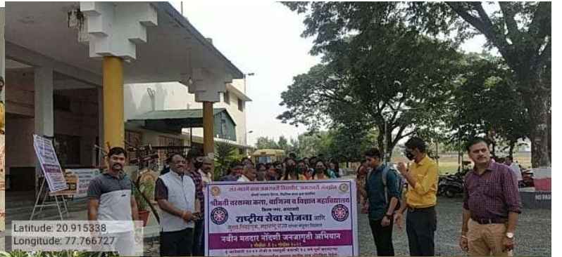
Latitude: 20.915338 Longitude: 77.766727