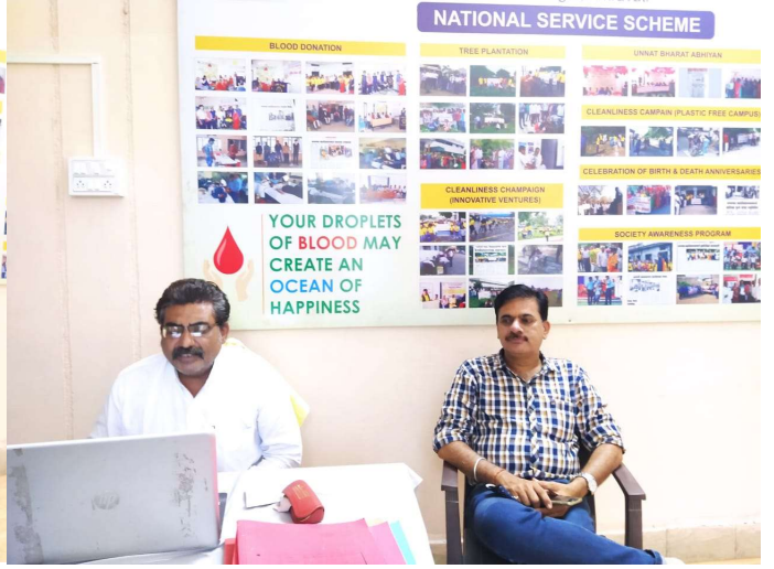
महात्मा गांधी व लाल बहादूर शास्त्री जयंती ०२/१०/२०२१