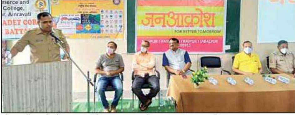
विद्यार्थ्यांना मार्गदर्शन करताना पोलिस उपायुक्त साळी व बाजूला मंचावर उपस्थित मान्यवर