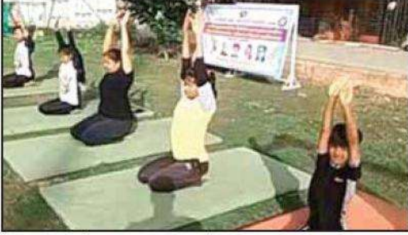
योगाचे प्रात्यक्षिक करताना विद्यार्थी