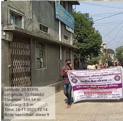
Latitude: 20.91596 Longitude: 77.766662 Elevation: 349.54 m Accuracy: 3.8 m Time: 26-11-2021 12:14 Note: sanvidhan diwas 9