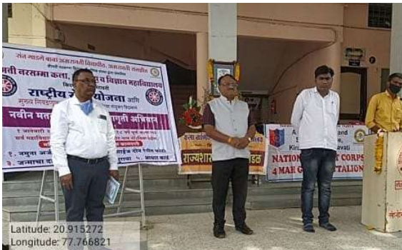
Latitude: 20.915272 Longitude: 77.766821