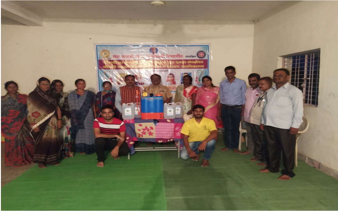
रस्ता सुरक्षा अभियान कार्यक्रम २५/०७/२०२१