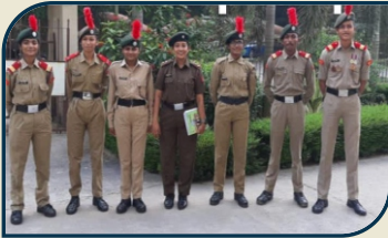
महाविद्यालयीन नॅशनल कॅडेट कोअर (एन.सी.सी.)