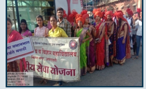
मराठी भाषा गौरवादानिमित्त्य ग्रंथदिंडीमध्ये सहभाग