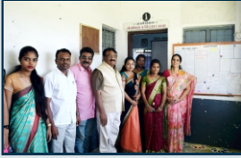
बीज अंकूरे अंकूरे भित्तीपत्रक उद्घाटन