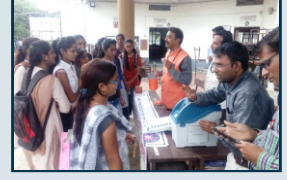
मतदान जागृती अभियान