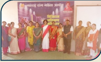
महिलांसाठी डिजीटल प्रशिक्षण कार्यशाळा