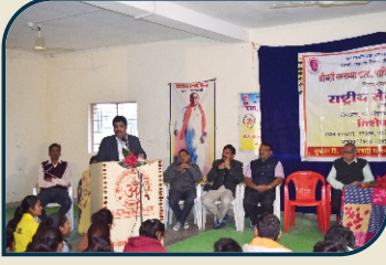
राष्ट्रीय सेवा योजना शिबिर उद्घाटन