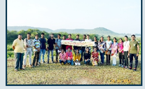
पक्षी निरीक्षण इकोक्लब