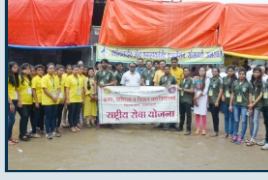
मातीचे गणपती जनजागृती