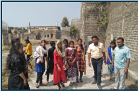
शैक्षणिक सहल (कला विभाग)