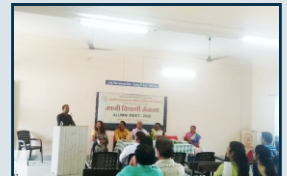
माजी विद्यार्थी मेळावा.