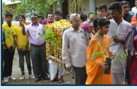
वृक्ष दिंडी पर्यावरण विषयक जनजागरण