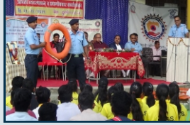
आपत्ती व्यवस्थापक कार्यशाळा