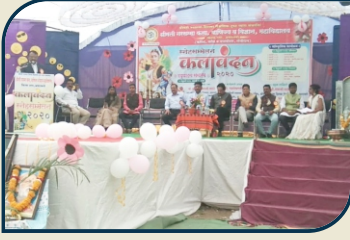
वार्षिक स्नेहसंमेलन कलावंदन - २०२०