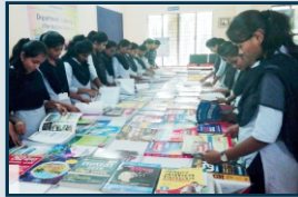
ग्रंथप्रदर्शनी (ग्रंथालय विभाग)