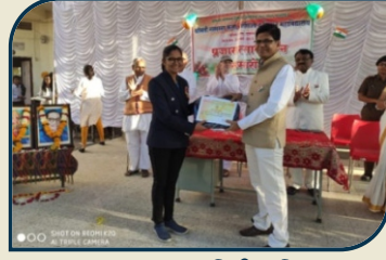
प्रजासत्ताक दिनी बकिस वितरण समारोह