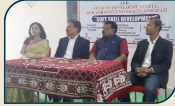
विद्यार्थ्यांसाठी विद्यापीठीय कौशल्य विकास कार्यशाळा