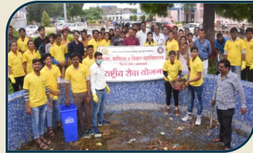
एन.एस.एस. स्वच्छता अभियान, अमरावती रेल्वे स्टेशन

श्रीमती नरसम्मा हिरय्या शैक्षणिक ट्रस्ट द्वारा संचालित