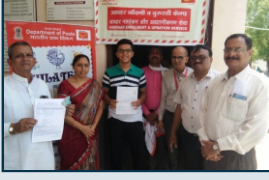
आधार नोंदणी शिबिर