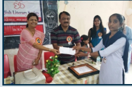
लीट-वॉल उद्घाटन (इंग्रजी विभाग)