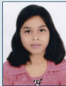
Ku. Pragati Petha, Jr. College