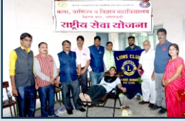
रक्तदान शिबिर अखंड भारत दिना निर्मित्य