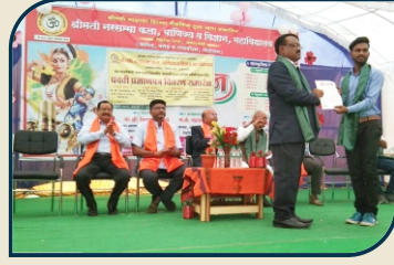
पदवी वितरण समारोह