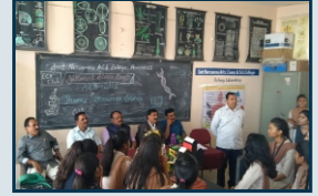
राष्ट्रीय विज्ञान दिवस