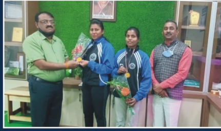
Felicitation (Baseball-National Level)