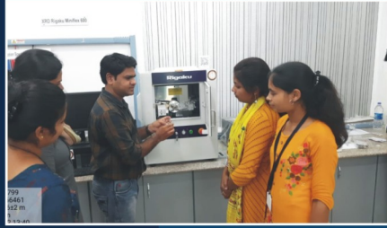
CIC Certificate Course