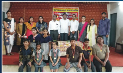
Mathematics Department Acitivity

श्रीमती नरसम्मा हिरय्या शैक्षणिक ट्रस्ट द्वारा संचालित श्रीमती नरसम्मा कला, वाणिज्य व विज्ञान महाविद्यालय (कनिष्ठ, वरिष्ठ, पदव्युत्तर व संशोधन) नरसम्मा परिसर, किरण नगर, अमरावती. फोन ०७२१-२५४०७९३ www.narsammaacsc.org