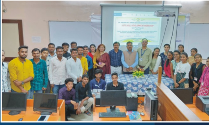
Soft Skill Development - Workshop