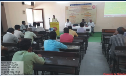
State Level Workshop for Non-Teaching Workshop