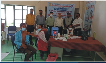
Covid-19 Vaccination Camp