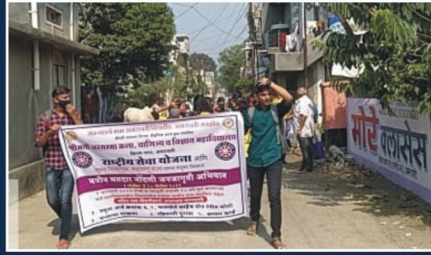
Voter Awareness Rally